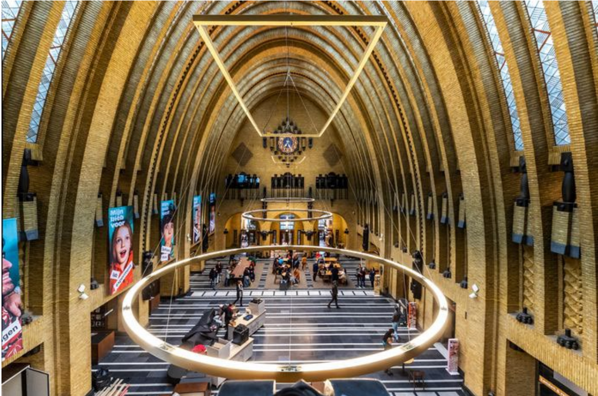
Bibliotheek in het oude postkantoor aan de Neude.