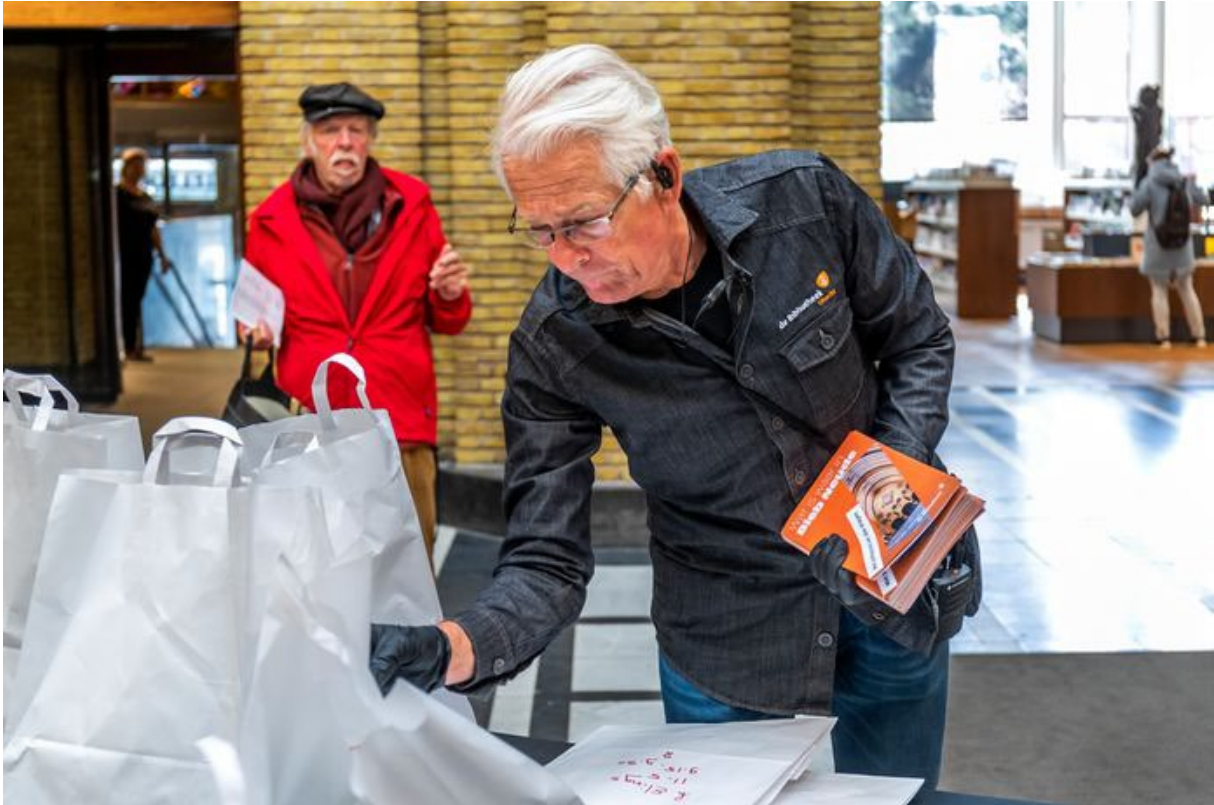
De nieuwe locatie van de centrale bibliotheek aan de Neude heeft relatief hoge huurlasten.